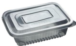
Ilustração do Produto